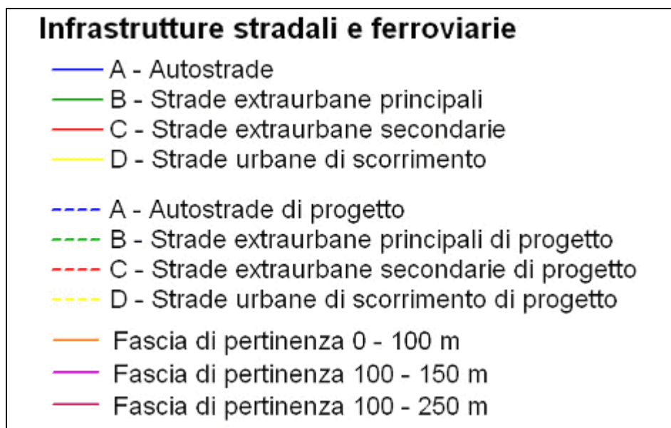
Figura 1 - Legenda delle infrastrutture di trasporto

Non è stato possibile individuare dette fasce di pertinenza nel caso dei Comuni di Bollate, Buccinasco, Novate Milanese, Pero, Trezzano sul Naviglio e Vimodrone, in quanto tali comuni non hanno fornito in tempo utile informazioni circa la classifica funzionale delle strade situate nel loro territorio.