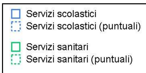
Figura 4 - Legenda dei recettori sensibili

Nella Figura 4 è riportata la legenda dei recettori sensibili.